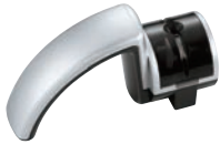
①ダイヤモンドロールシャープナー ㊦