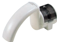
②ウォーターロールシャープナー 両刃用 ㊦