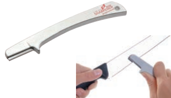
⑥イスター プロフェッショナル シャープナー ㊦

イスター・スイスシャープナーは、従来のシャープナーとは全く異なる コンセプトで刃物の切れ味をよみがえらせます。 刃物を削るのではなく、整えながら研ぐのです。 このため、「バリ」と呼ばれる金属のめくれ(かえり)がほとんど発生 しないので、刃物を傷めることなく、高精細に研ぐことができます。