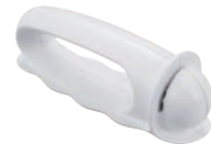
⑦波刃が研げる シャープナー ㊦