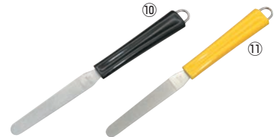
ダイヤモンドシャープナー しなり ㊦