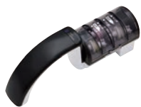
⑤庖丁研ぎ器 トリプルシャープナー プロ ㊦