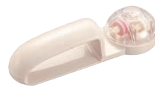
③ウォーターシャープ ㊦