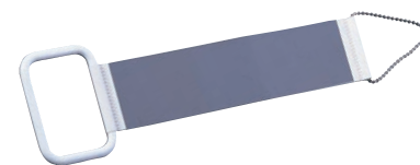
⑭庖丁研ぎ とげるんです