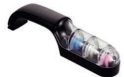
④ウォーターシャープⅢ ㊦